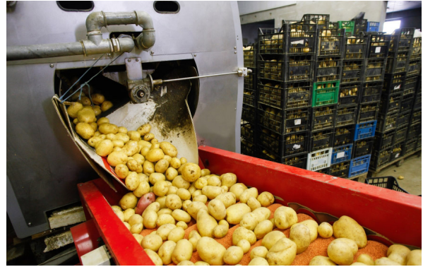
↑ Varil Yıkayıcı