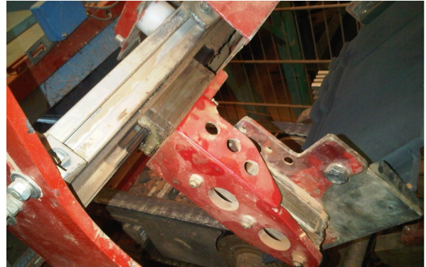
↑ Seramik Kiremit Üreticisi